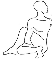
postura de Matsyendra